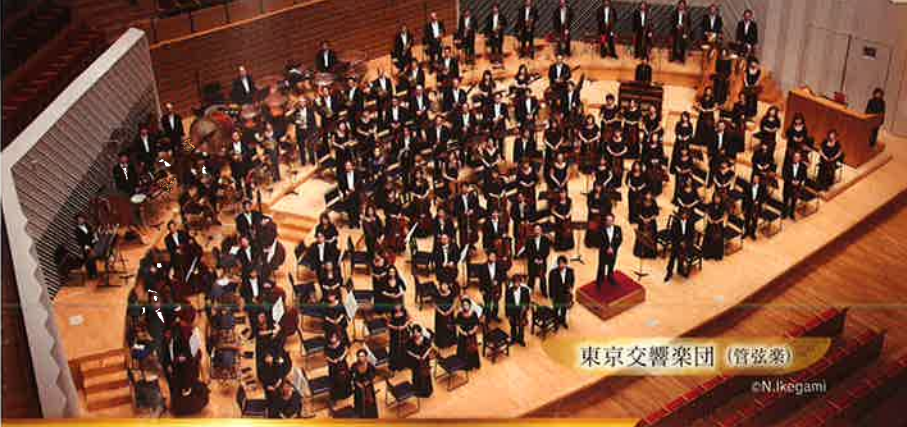
東京交響楽団 (管弦楽)