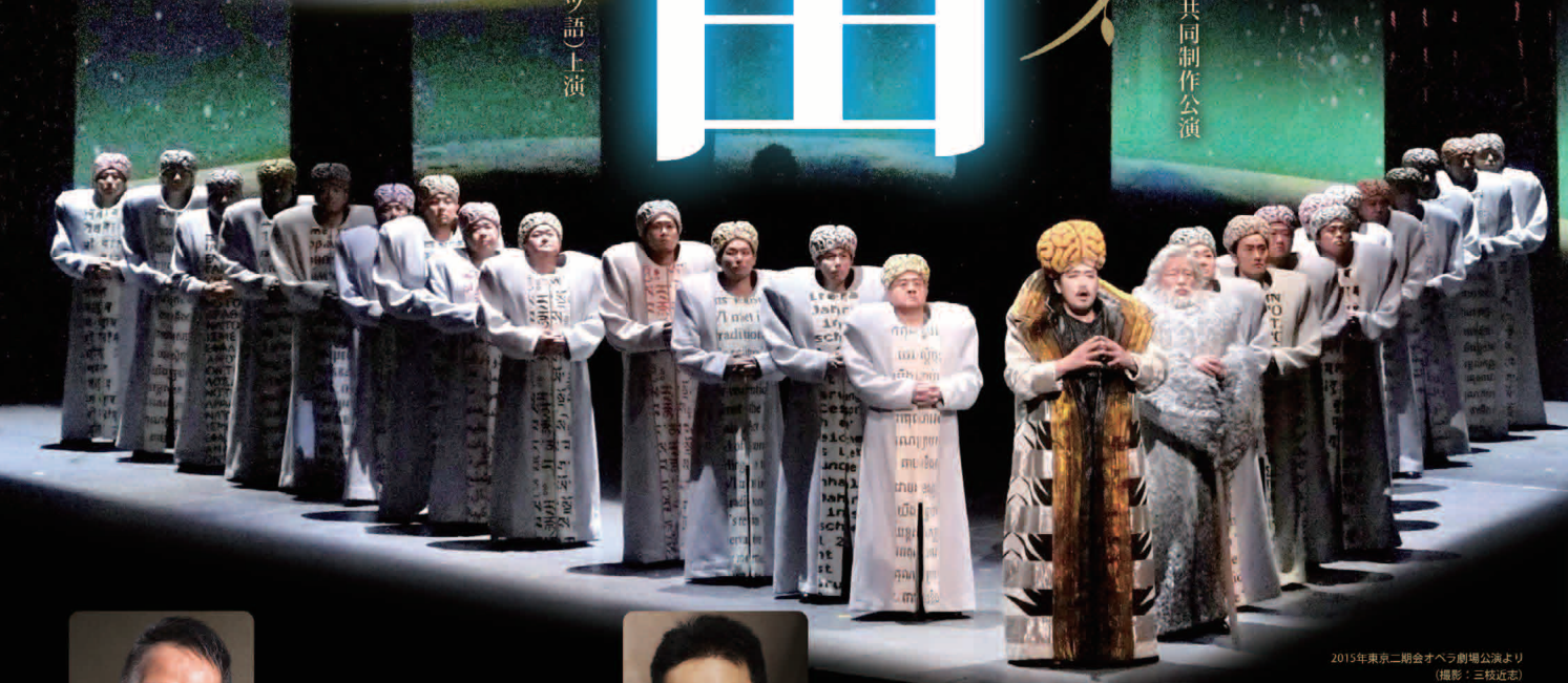
2015年東京二期会オペラ劇場公演より